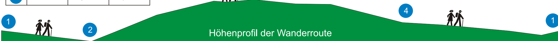
Höhenprofil der Wanderroute